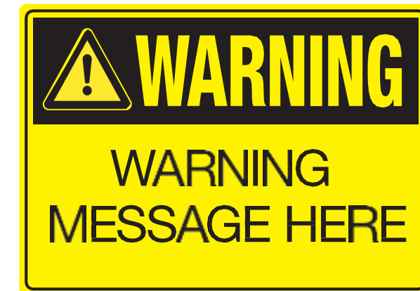
Individuell gestaltbares Schild